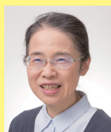
松井三枝 教授 金沢大学 神経心理学